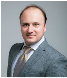
ボヤン・チチッチ (ヴァイオリン)

1995年、紀尾井ホール開館時に紀尾井シンフォニエッタ東京として発足。国内外の第一線で活躍する演奏家が集い、設立当初の首席指揮者・尾高忠明(現・桂冠名誉指揮者)のリーダーシップのもと、多くの音楽家と共演を重ね、我が国を代表する演奏団体の一つとなる。高い演奏技術とアンサンブル能力に裏打ちされた音楽性には定評がある。欧州ツアー(2000年)、ドレスデン音楽祭出演(05年)、米国公演(12年)等、国内外で演奏活動を展開。17年4月、首席指揮者にライナー・ホーネックを迎え、「紀尾井ホール室内管弦楽団」に改称。活動の幅を広げながら、より洗練された音楽作りを目指している。(運営:新日鉄住金文化財団)